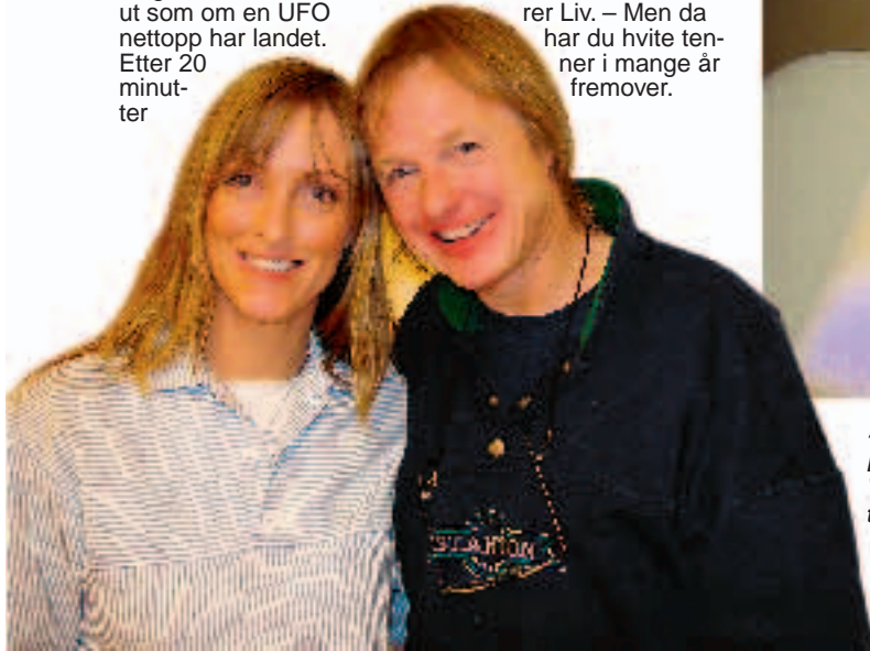
"BRITE SMILES": Nå smiler både Liv og Vi Menn med nye, hvite tenner.